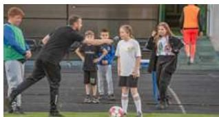
Lansarea proiectului Community Development Officer (CDO)