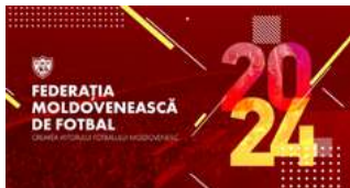
Lansarea Strategiei FMF 2020-2024