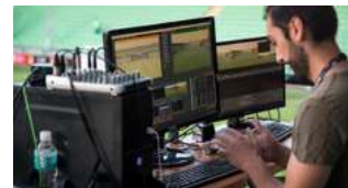
Transmisiune live a campionatului Moldovei cu 5 – 7 camere