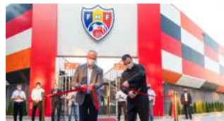
Inaugurarea Arenei FMF de fotbal pe plajă din parcul “La Izvor”