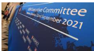
Moldova găzduiește ședința Comitetului Executiv al UEFA