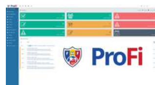
Digitalizarea proceselor și introducerea sistemului ProFi FMF