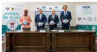
Semnarea Memorandumului de colaborare cu Ministerul Educației și Cercetării