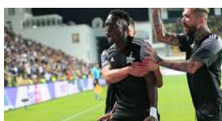
Prima dată în istorie - FC Sheriff participă în grupele UEFA Champions League