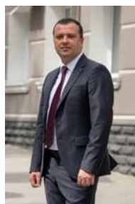
Leonid Oleinicenco, Președinte al Federației Moldovenești de Fotbal

Să visăm și să acționăm cu Responsabilitate și Pasiune, și să lucrăm în Echipă. Mulțumim colegilor de la UEFA pentru asistență valoroasă în procesul de elaborare a Strategiei 2025 - 2030, care integrează și mai strâns fotbalul moldovenesc în fotbalul european și global.