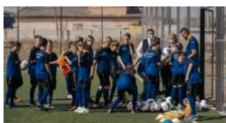
Lansarea primei clase specializate de fotbal în Sipoteni, raionul Călărași