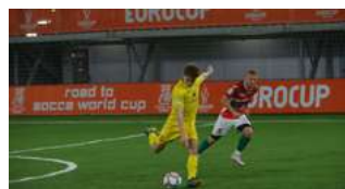
Moldova, gazdă a competițiilor internaționale la socca, fotbal pe plajă și futsal