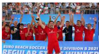
Echipa Națională la fotbal pe plajă a învins în Divizia B a Campionatului European