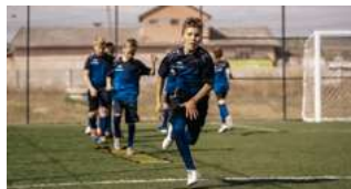
Lansarea Programului “Fotbal în Școli”